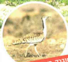
חובה. מאבדת שטחי מחיה