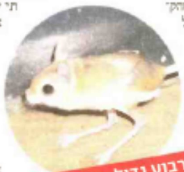
ירבוע גדול. כבר לא רואים

בסופו של דבר נאלצו אנשי קק"ל "לקלף" את האספלט שנסלל בשטח בני