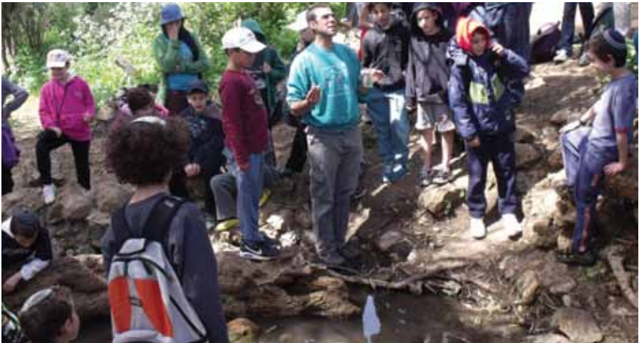
↑ קבוצת מטיילים בעין מטע. הנגשה של מעיין לציבור היא פעולה שיש לבצע לאחר חשיבה על ממשק נכון של הקהל ותחזוקת האתר

במעיינות בעלי חשיבות אקולוגית שמירת הטבע צריכה לקבל עדיפות על הרצון להנגשת הציבור. ההחלטה להגבלת הטיילות ראוי שתעשה על בסיס מידע קיים ממחקרים וסקרים וחוות דעת של אקולוג.