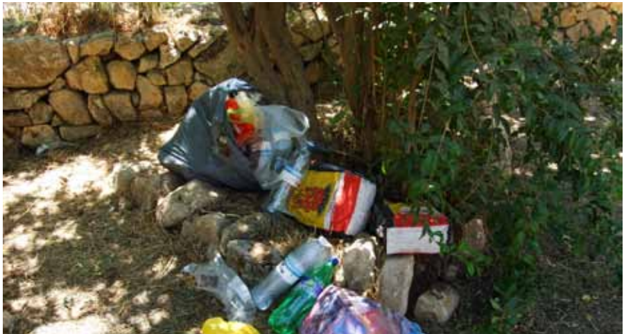
↑ פסולת בעיינות תלם / אלון רוטשילד

יש להטמיע בתהליך קבלת ההחלטה על פיתוח אתר ו/או הנגשתו לציבור את מידת היכולת של הגוף המנהל להבטיח תחזוקה ופיקוח נאותים לאורך זמן, שיאפשרו שמירת האיכויות האקולוגיות של האתר ("סוף מעשה – בתחזוקה תחילה").