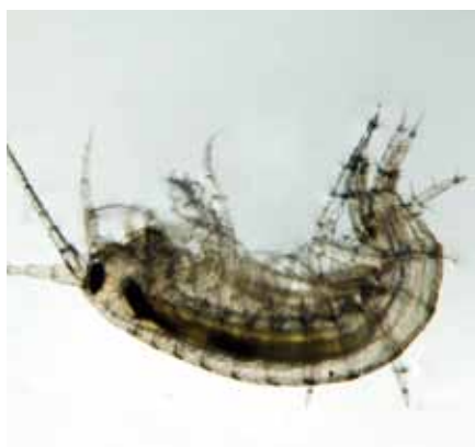
↑ שחריר חלק (Melanopsis buccinoidea) / עוז ריטנר ↓ צידפנית (Ostracoda sp.) / לירון גורן