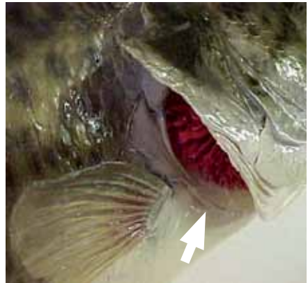
† דוגמאות לרגישות אברי נשימה בבעלי חיים המצויים באזורי מעיינות ונחלים. בתמונה מסומנים בחץ שחור זימי הדג מתחת למכסה הזימים