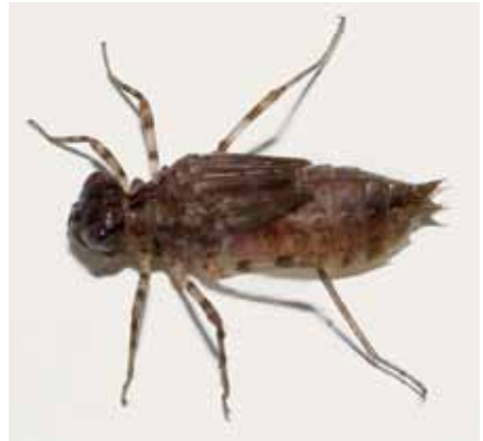
↑ פשפש מסוג שטגב / לירון גורן ↓ פשפש מסוג חותרן / לירון גורן