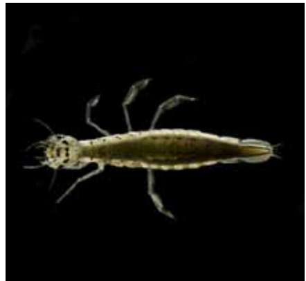
↑ שפיריית הדורה בוגרת / לירון גורן ↓ חיפושית שחיינית בוגרת / לירון גורן