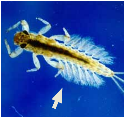
† החץ השחור מסמן את זימי הטרכיאה משני צידי גוף הנימפה של ברום. איברים אלו עדינים ופגיעים להרחפת חומרים מקרקעית גוף המים

לשם כך המעיין צריך להיות מנוהל על ידי רשות מתאימה (רשות הטבע והגנים, רשות נחל וכו') אשר תקבע את כללי ההתנהגות המותרים לכל מעיין בהתייעצות עם אקולוג, תציב שילוט ותבצע הסברה ואכיפה.