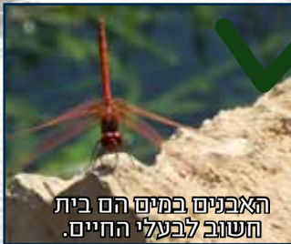
האבניים במים הם בית חשוב לבעלי החיים.