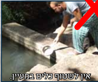
אין לשטוף כלים במעיין.