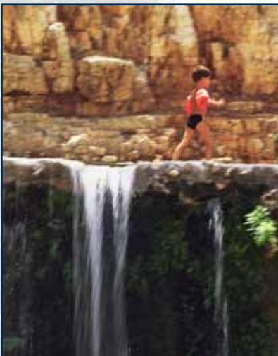
ואדי קלט, עין פואד

הפגיעה העיקרית במעיין נגרמת כתוצאה מהכנסת דגים זרים למים (למשל גמבוזיות ומיני קרפיונים כגון דגי זהב וקרפיון קוי), המהווים "מינים פולשים". נוכחות דגים אלה משבשת כליל את מארג החיים האקולוגי במעיין, ומותירה שממה אקולוגית - הדגים טורפים את בעלי החיים המקומיים, או מתחרים איתם על מקורות המזון. לציבור המשתמש במעינות להנאתו תפקיד חשוב בשמירתם - אנא עזרו לנו לשמור על הטבע הישראלי שלנו.