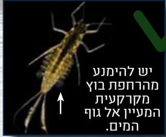
יש להימנע מהרחפת בוץ מקרקעית המעיין אל גוף המים.