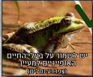
יש לשמור על בעלי החיים האופייניים למעיין. (צפרדע נחלים)