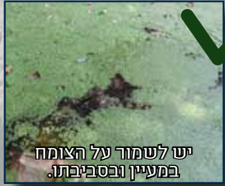
יש לשמור על הצומח במעיין ובסביבתו.