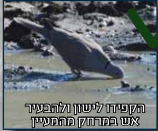
הקפידו לישון ולהבעיר אש במרחק מהמעיין