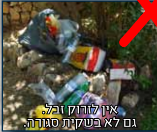
אין לזרוק זבל. גם לא בשקית סגורה.